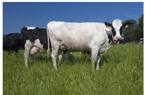
Imatge 1. Vaques pasturant en un prat.

La constitució del ramat ecològic es pot fer directament introduint animals ecològics a l'explotació. En el cas de que no es disposi d'animals certificats per iniciar l'activitat, també es podrà constituir el ramat introduint animals no ecològics, però únicament animals joves amb finalitat de cria que s'hauran d'introduir immediatament després del seu deslletament. En el cas de vedells i poltres, aquests hauran de tenir menys de 6 mesos, i, en el cas d'anyells i cabrits, aquests hauran de tenir menys de 60 dies. Cal tenir en compte la capacitat d'adaptació i resistència de les diferents races i estirps a l'hora de constituir el ramat, donant preferència a les autòctones.